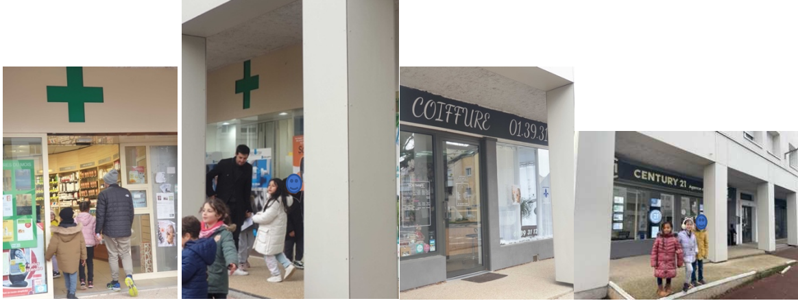
des commerces (pharmacie, coiffeur, agence immobilière)