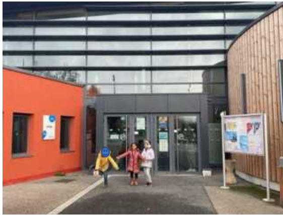
la piscine « Les océanides »