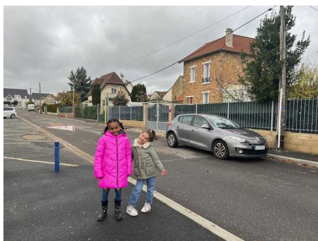
des habitations (maisons)