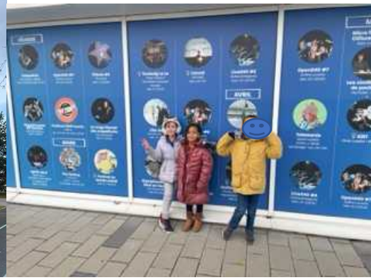
le Studio 240