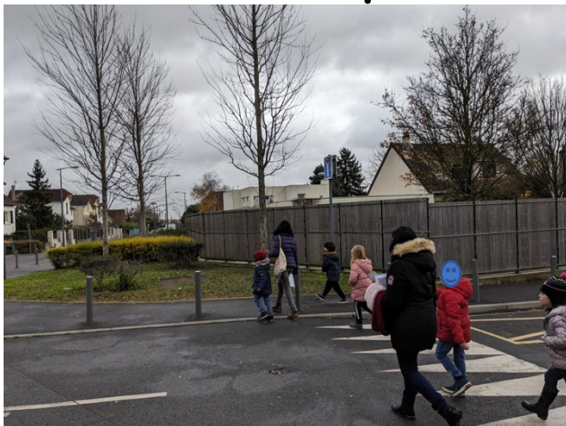
des habitations (maisons)