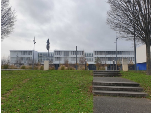
le nouveau lycée