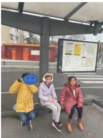
un arrêt de bus