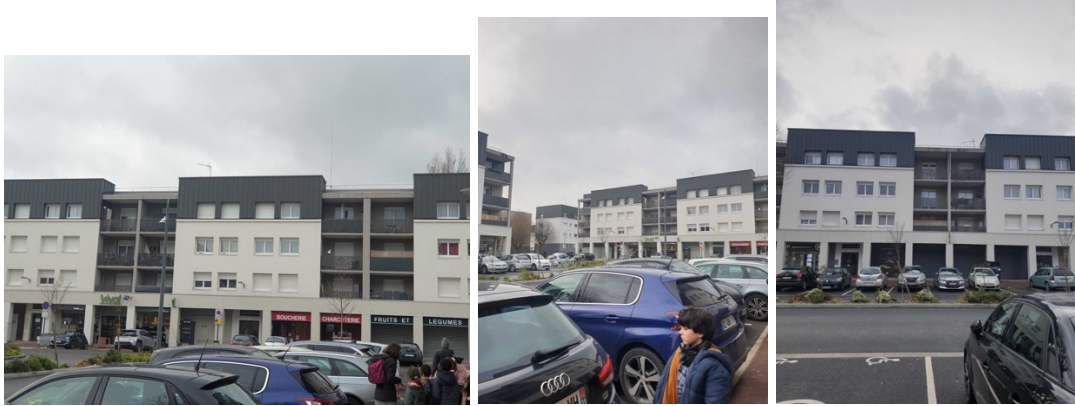
des habitations (immeubles)