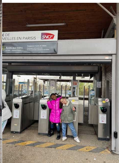
l'entrée de la gare