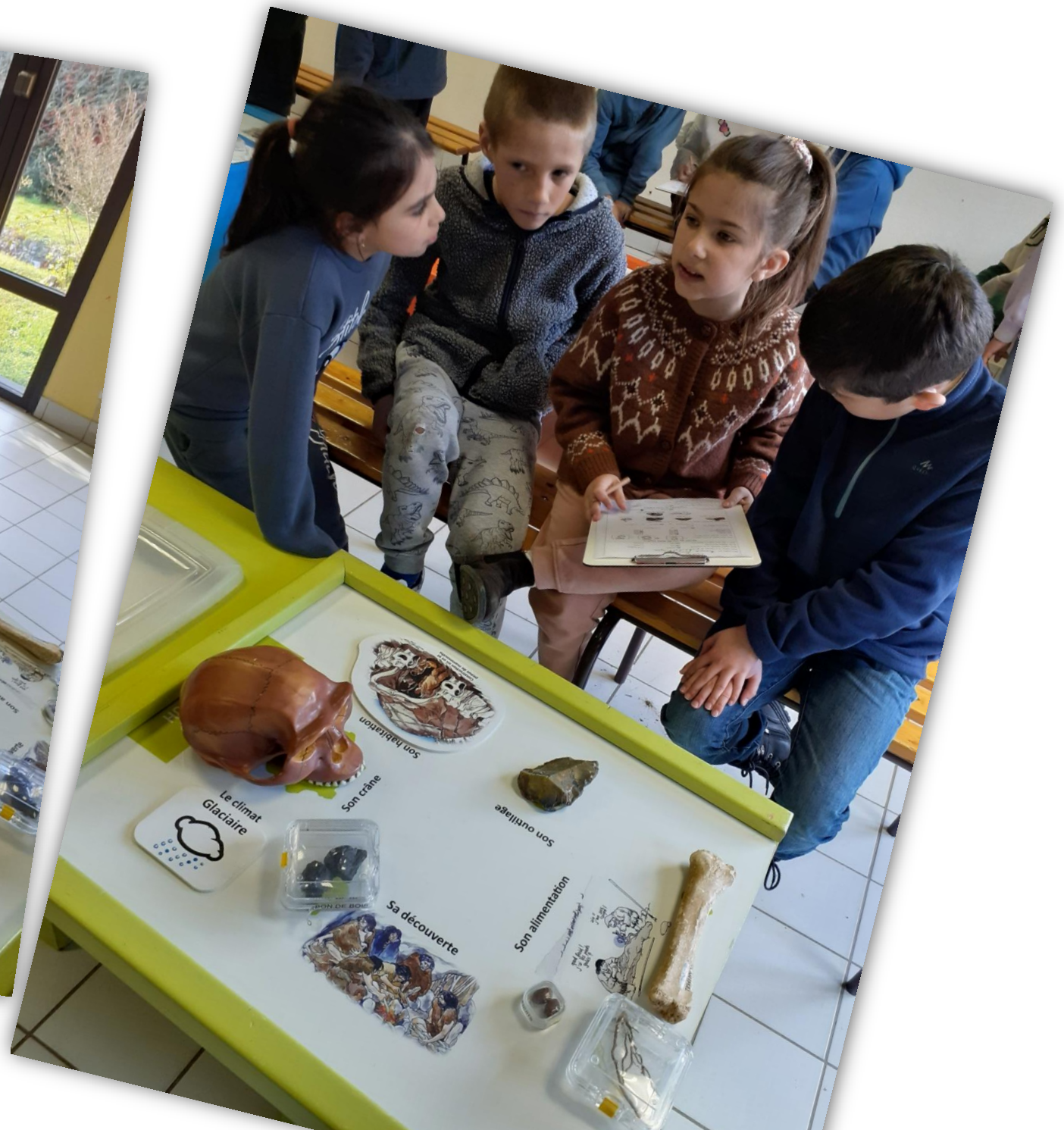
Un vrai travail de recherche et d'équipe...