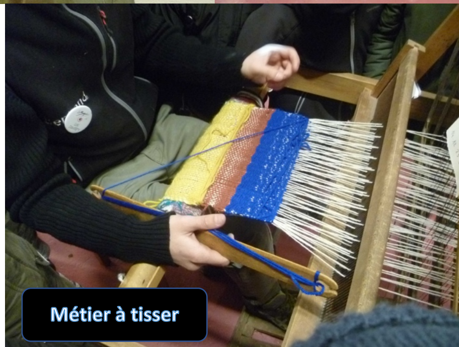
Métier à tisser