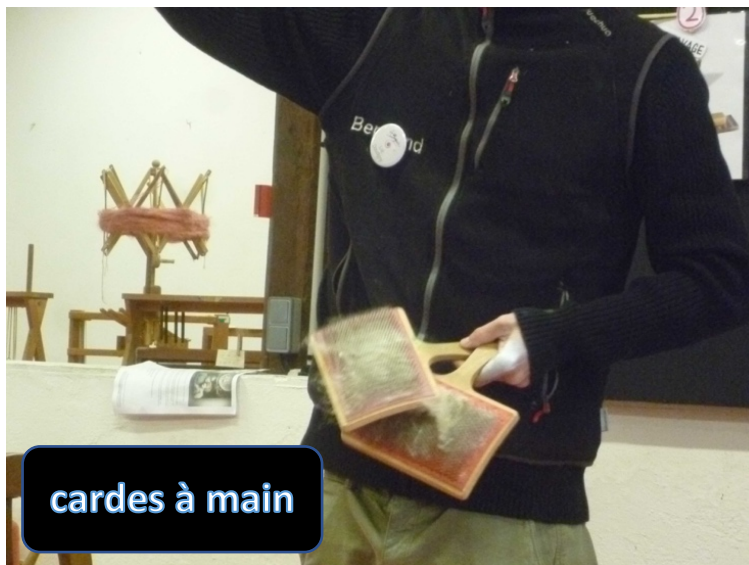
cardes à main