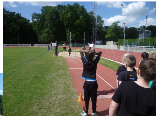
Saut en longueur