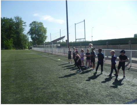
Jeu du bétet