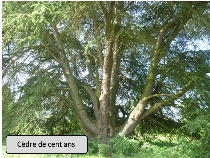
Cèdre de cent ans